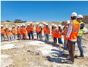
Foto de grupo en la Cantera de Gerena donde los estudiantes vieron una voladura controlada.

Visita a las obras de adecuación del tratamiento de la EDAR de Sevilla para el vertido a zona sensible donde los estudiantes vieron un procedimiento de hinca.