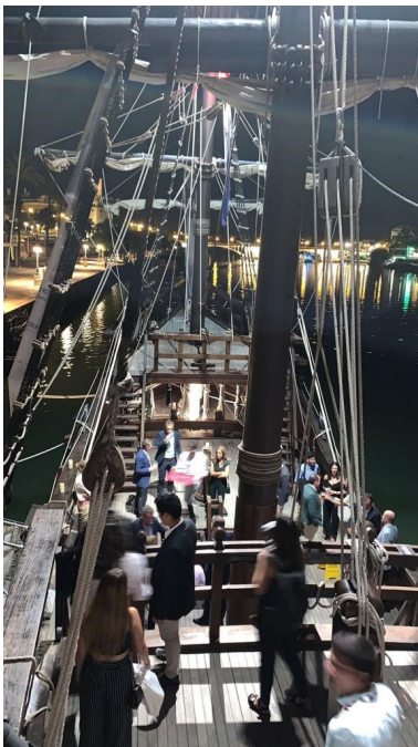
Cena en la Nao Victoria 500 de los participantes en el XI Curso Práctico de Construcción en Obras Públicas