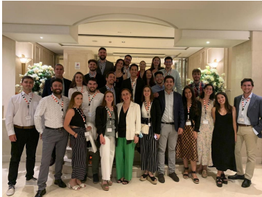
Foto de grupo de los asistentes al curso en la tercera jornada celebrada en el Hotel Sevilla Center

El tercer día del curso, los estudiantes se desplazaron a Sevilla donde recibieron diferentes sesiones informativas sobre Construcción y Conservación de Infraestructuras Viarias, Hidráulicas y Portuarias, Dirección de Obras y Proyectos, Gestión de Infraestructuras así como una presentación del Colegio de Ingenieros de Caminos, Canales y Puertos a cargo de profesionales del primer nivel en cada uno de los ámbitos. La jornada finalizó con una cena en la Nao Victoria 500.