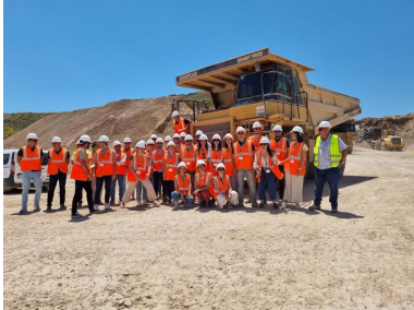
Foto de grupo junto con la maquinaria empleada para el movimiento de tierras en la ejecución de los trabajos de la autovía del Almanzora.