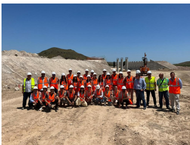
Foto de grupo tras la visita a obra de la construcción de la Autovía del Almanzora.