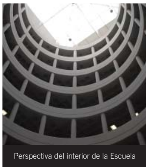
Perspectiva del interior de la Escuela