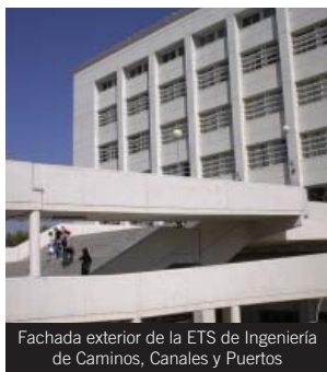
Fachada exterior de la ETS de Ingeniería de Caminos, Canales y Puertos

Líneas: Acceso al Campus de Fuentenueva: N1, N3, N9, C6, SN1, U2.