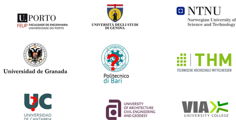
Figura. Socios de la red interuniversitaria para el SEMESTRE INTERNACIONAL

Con objeto de fortalecer la relación con la ESITC de Caen y hacer una oferta más atractiva a los estudiantes de ambas escuelas, se ofrece desde el curso 2021-2022 una estancia formativa denominada SEMESTRE INTERNACIONAL , en el que además de la ESITC de Caen participan otros socios europeos (ver figura siguiente).